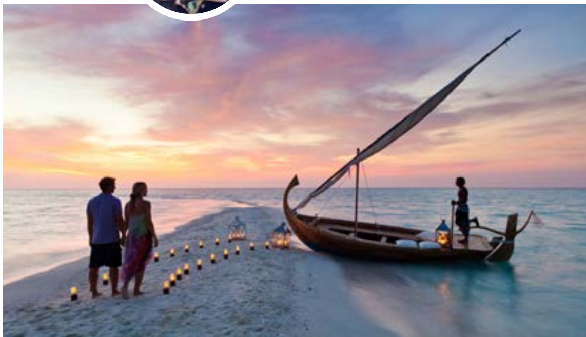
El turismo ha reverdecido tanto, que el mismo excursionista puede organizar su viaje a cualquier continente.

gué a este tema convenciéndome de que viajar a otros países acarrea una empresa descomunal: presencia en las agencias de viaje, compra de tickets, visita a las embajadas para pedir la visa, maletas abultadas, paseo hasta el aeropuerto, filas eternas frente a la aerolínea contratada, en fin. Una odisea de horas interminables.