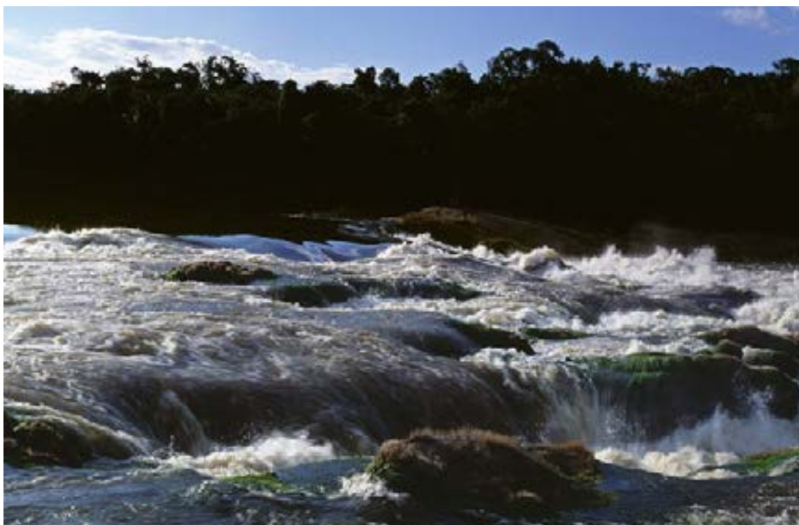
Rápidos del río Apaporis, afluente del Amazonas que recorre una de las zonas con mayor biodiversidad y riqueza cultural del país.

El proceso incluyó cartografías participativas y la vivencia en ceremonias tradicionales (como el baile del chontaduro), donde el investigador comprendió que la «educación ambiental no se enseña en un aula sino