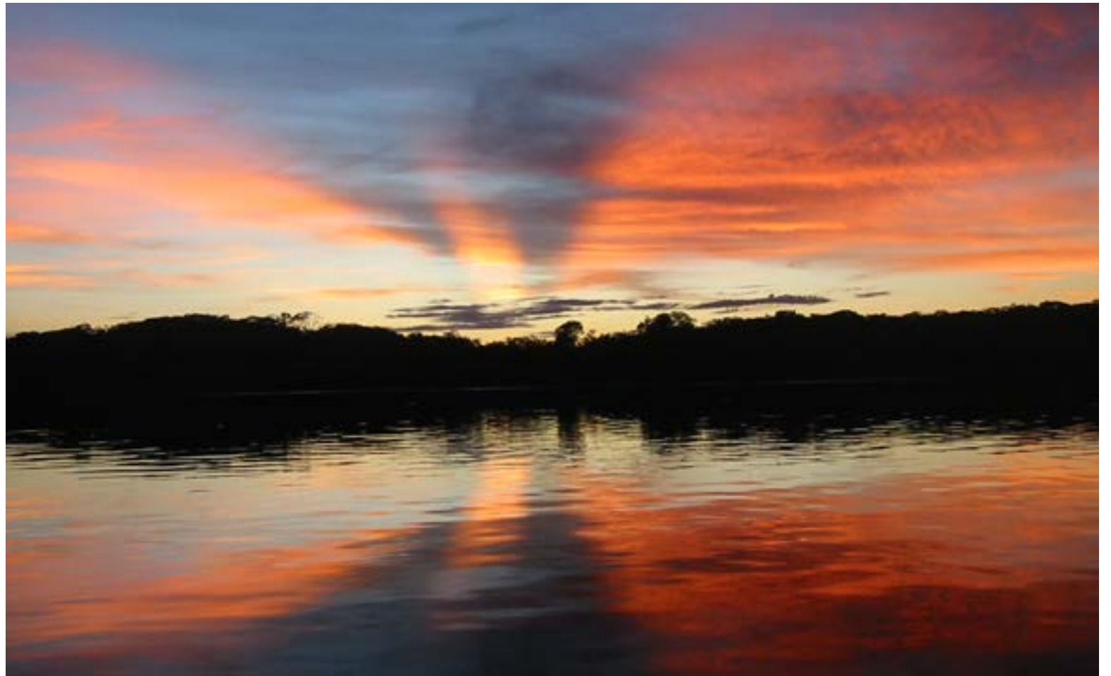
Los costos sociales los llevan colonos y nativos indígenas, ancestrales pobladores que ven desbastadas sus tierras.

En el evento se abordó el complejo problema de la colonización campesina y se concluyó con el lamentable espectáculo de la desincronización en el país para articular el trabajo de los diferentes sectores académicos dedicados a la contextualización de esta problemática con los gobiernos y las comunidades regionales. Se analizó cómo el espacio bolivariano y su campesinado son actores centrales del desarrollo latinoamericano y el proceso de colonización de la Amazonia se realiza de manera indiscriminada, destruyendo bosques para sustituirlos por parcelas que