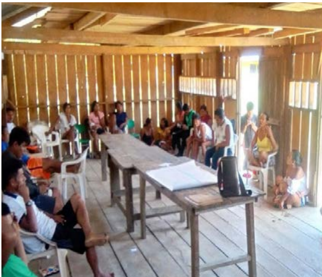
Integrantes de la comunidad de Bocas del Pirá durante uno de los talleres de diálogo intercultural sobre gestión ambiental y educación local.

en el cuerpo». Se generaron dos documentos clave contruidos colectivamente y ratificados por el Consejo Indígena del Yaigojé Apaporis (CI-TYA):