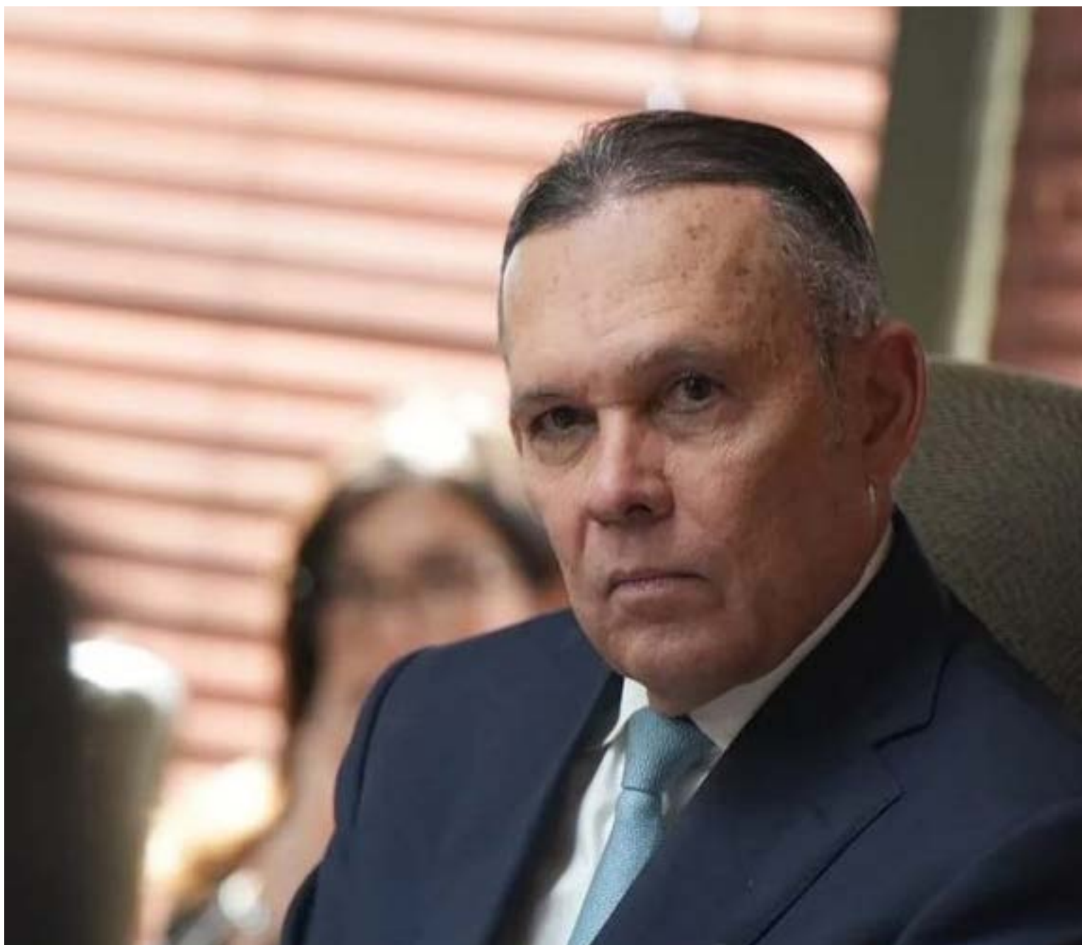
Efraín Cepeda Sarabia, precandidato presidencial, senador de la República y jefe del Partido Conservador.