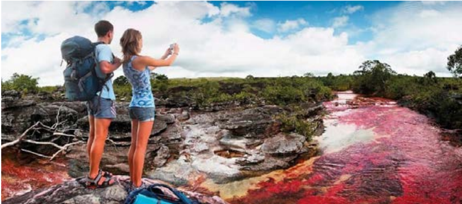
Colombia «el País de la Belleza».